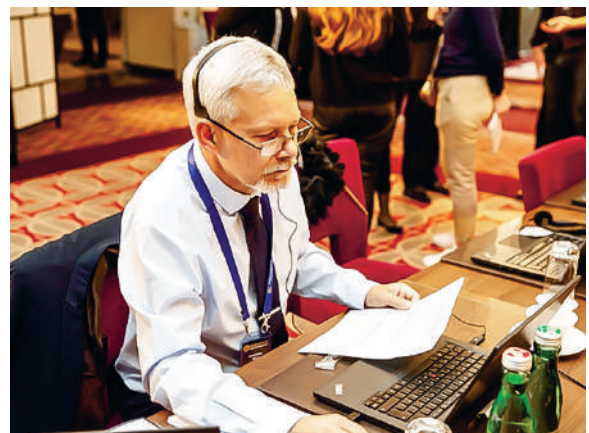
Бен Делл на Конгрессе руководящего состава Первого Космического Государства Асгардия

Первое официальное чтение прошел Закон о национальной валюте, проект которого представил заместитель председателя Парламента и председатель Комитета по иностранным делам Бенджамин Делл. Закон уже обсуждался парламентариями во время очередного Законодательного форума (на онлайн-встрече, состоявшейся между сессиями). Он определяет