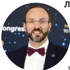
Лука Сорризо-Вальво, председатель Комитета по науке Парламента Асгардии

Через 30 лет нас будет гораздо больше — Асгардия может объединить 150 миллионов граждан. И все эти люди, увлеченные космонавтикой, станут активными участниками космической индустрии и космической жизни.