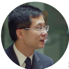
Юн Чжао, Председатель Верховного суда Асгардии

А через 30 лет у нас будут представительства на континентах и посольства в разных странах. У нас появятся поселения на земной орбите и на Луне. Мы будем организовывать тестовые полеты в межгалактическое пространство. И, конечно, к этому времени первый человек родится в космосе — это будет асгардианец.