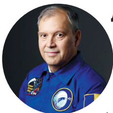
Думитру Дорин Прунариу, румынский космонавт, член Парламента Асгардии

II Конгресс руководящего состава Асгардии в ноябре прошлого года неслучайно проходил в Таллине. Эстония сейчас является примером для других государств. Эта страна позволила людям выбирать членов парламента через интернет, провела цифровую перепись населения и предложила иностранцам получить цифровое гражданство. А мы изначально идем по пути построения цифрового государства: все государственные услуги в Асгардии будут предоставляться в цифровом формате.