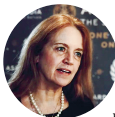
Шерил Галлахер, председатель Комитета по культуре Парламента Асгардии

Думаю, что через 30 лет наша суверенная территория расширится. Это будет уже не только спутник, но и космический ковчег — станция, вращающаяся на орбите Земли. И мы надеемся, что к этому времени Космическое Государство уже будет признано на международном уровне.