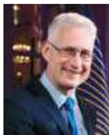
Лембит ОПИК, спикер парламента Асгардии: «Я чувствую себя на орбите»

В прошлом член британского парламента и лидер валлийских либеральных демократов Лембит Опик (Lembit Öpik) ныне называет себя звездным политиком. Опик стал одним из первых избранных членов парламента первого космического государства. На церемонии инаугурации главы нации 25 июня в Вене он присутствовал уже в качестве главы парламента.