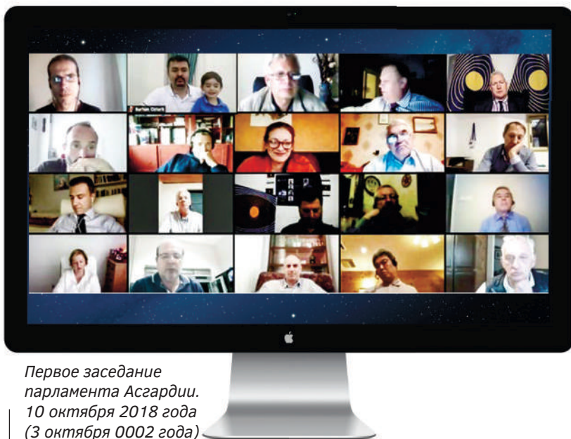
Первое заседание парламента Асгардии. 10 октября 2018 года (3 октября 0002 года)