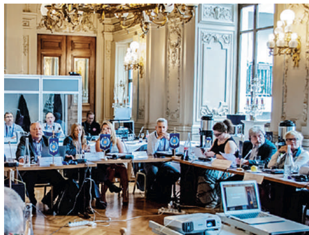
Первый экономический форум Асгардии